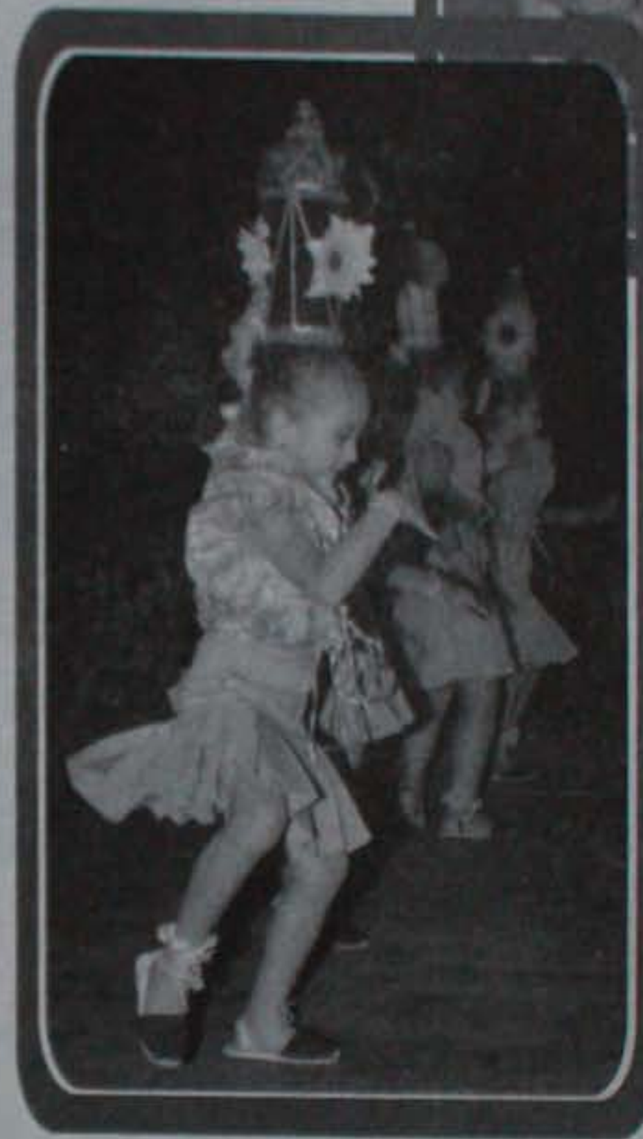
Reportaje: Elsa Bejarano