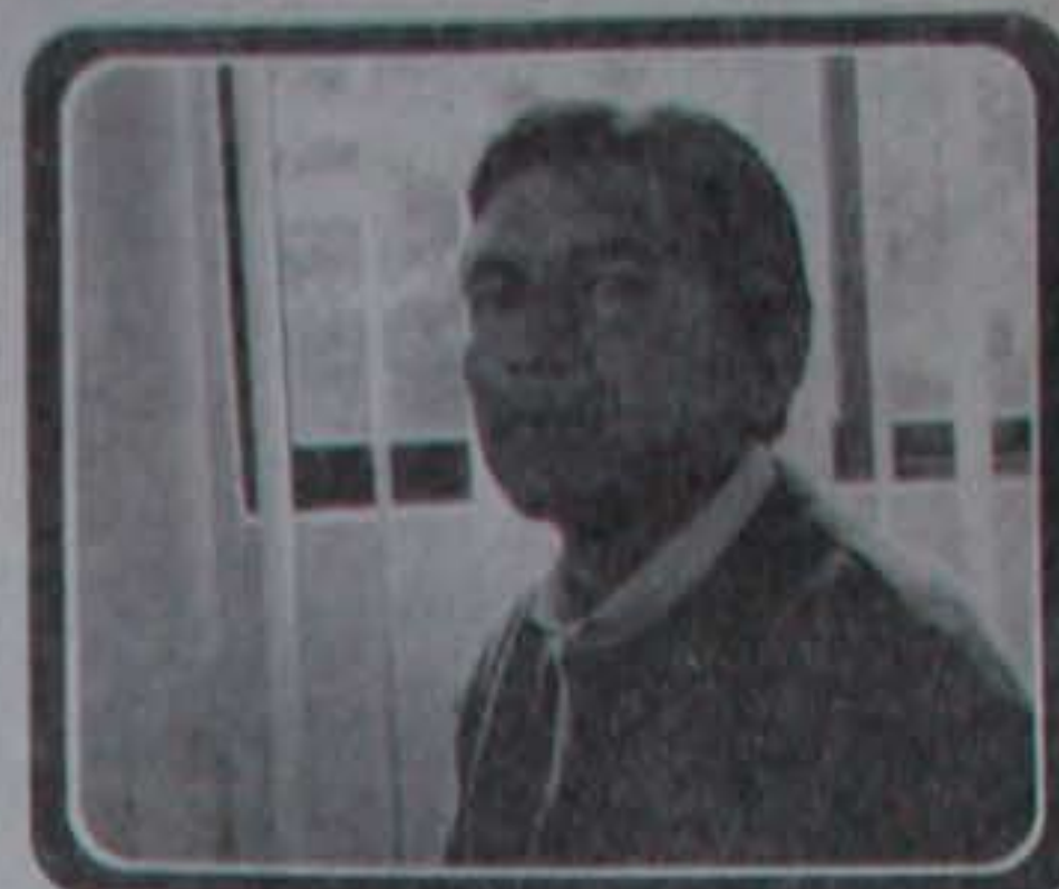
Reportaje: Elsa Bejarano