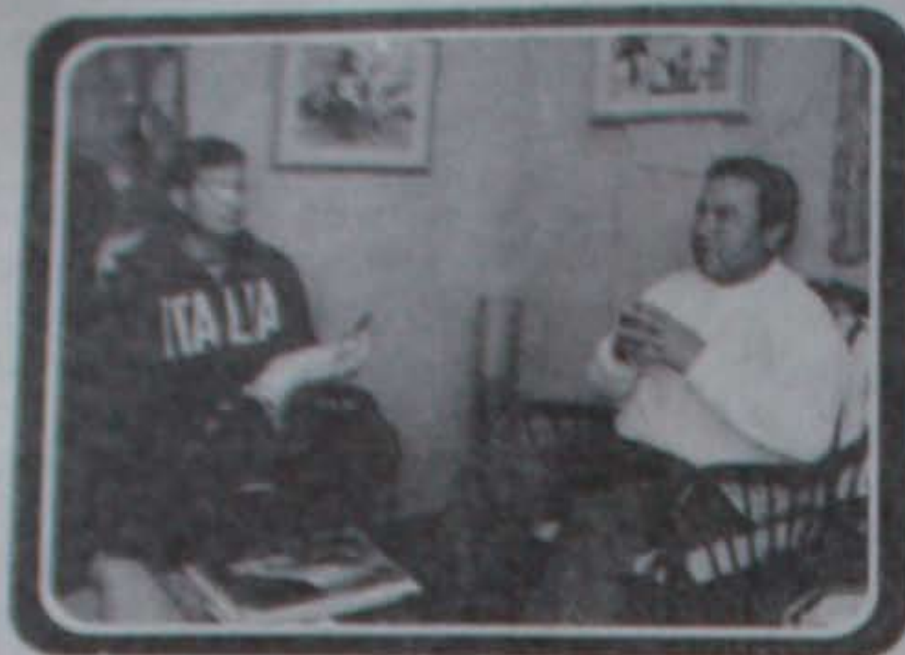
Es necesario conocer lo nuestro para querer

Los centros culturales son espacios creados para fortalecer, revitalizar y mantener la cultura de una parroquia, sin embargo, muchas veces estos no son utilizados de la manera que corresponde.