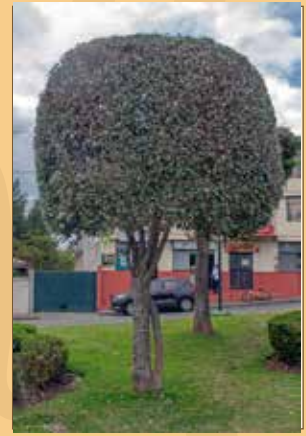
Álamo blanco o plateado ( Populus alba )

Es un ejemplar de una especie con características de interés para los espacios urbanos, ofrece una sombra fresca. Puede vivir más de 300 años, este ejemplar es muy joven aún!