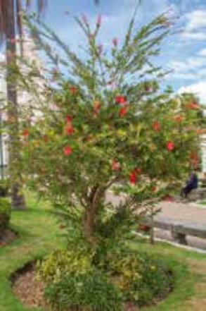
Cepillo rojo, limpia botellas ( Callistemon citrinus )

¿Cuántos arboles hay de cada especie en el Parque?