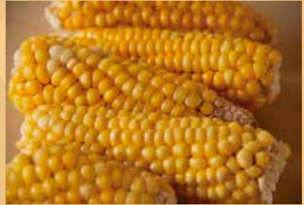
Mazorcas de morochito amarillo