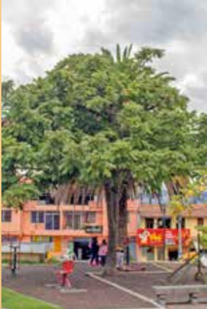
Nogal andino, Tocte ( Juglans noetropica )

Especie considerada noble por la calidad de su madera. Fruto comestible, sus hojas se usan para la colada morada y otras recetas, también usada para asear la dentadura cuando no existían los dentífricos.