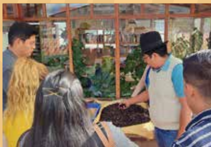
Laboratorio de Innovación Rural