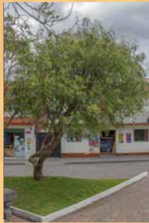
Molle, Falso pimentero ( Schinus molle )

Una especie considerada noble por la calidad de su madera, actualmente ya no se encuentran ejemplares de gran tamaño por su exagerada extracción para artesanías. Su fruto es comestible y de él se obtiene aceites de alta calidad gastronómica.