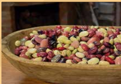
Semillas de Frejol