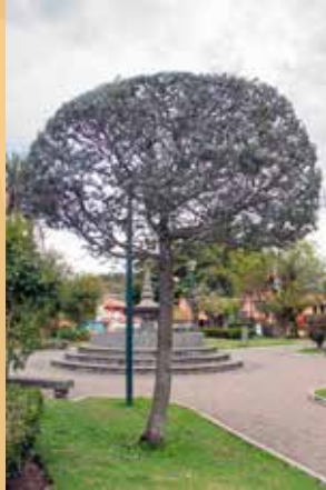
Acacia azul ( Acacia baileyana )

Es un ejemplar de una especie usada netamente con fines ornamentales. Padece de mala práctica de poda.