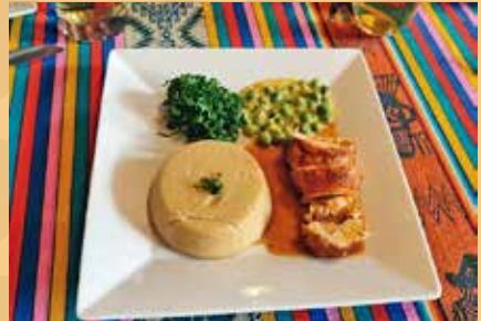
Mashcasango (Plato tradicional)

La profesión de agricultor es importante para que mi parroquia sea turística. Por eso sobrinos les voy a llevar a conocer nuestras plantitas, a valorar a los comuneros y huertos agro ecológicos.