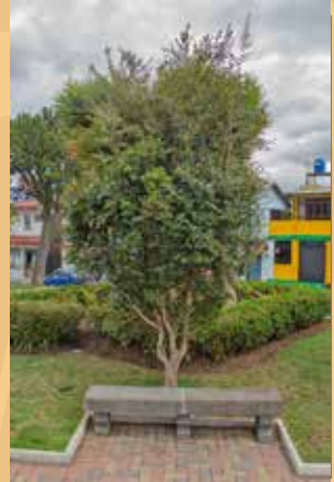
Arrayán ( Myrcianthes hallii )

Ejemplar de una especie con valor ornamental, con ciclo de vida corto que oscila entre los 15 y 25 años. ¿Sabías qué las acacias generan metano en su metabolismo?