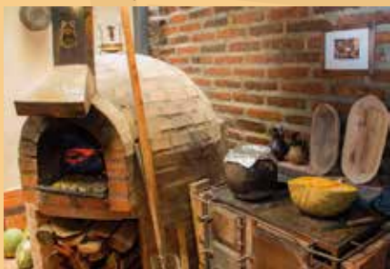
Cocina de leña